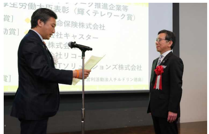
表彰状授与の様子