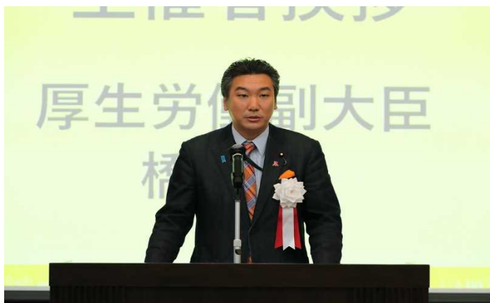
橋本厚生労働副大臣による主催者挨拶