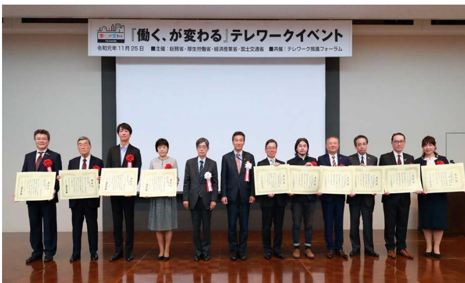
受賞者合同記念撮影の様子